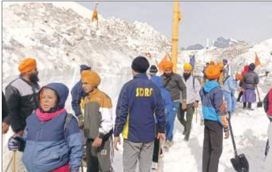
हेमकुंड साहिब यात्रा को लेकर मार्ग ठीक करती हुई टीम।

इस तरह के अभियान करने से आने वाली चुनौतियों का सामना करने में आसानी होती है: सीएम धामी