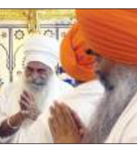
की बेहदरी और सुरक्षा और देश की खुशहाली और तरक्की के लिए अरदास की। तख्त सच्चखंड श्री हजूर साहिब सिक्ख कौम का बहुत ही सल्कार वाला स्थान है जिसको अकाल पुरुष की शक्ति का केंद्र भी माना जाता है। श्री सिरसा ने बताया कि गृह मंत्री देश के लोगों को बेहदरी संभव सेवाएं दे कर