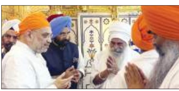
टीम एक्शन इंडिया/नई दिल्ली केंद्रीय ग्रह मंत्री अमित शाह तख्त सच्चखंड श्री हजूर साहिब महाराष्ट्र में नतमस्तक हुए। उनके साथ भाजपा के सिक्ख नेता सरदार मनजिंद सिंह सिरसा भी थे। उन्होंने महाराष्ट्र में से मुहिम शुरू करने से पहले अकाल पुरुष का आशीर्वाद लिया। श्री शाह ने देश के लोगों