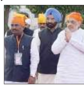
लोगों की सेवा करने के लिए आशीर्वाद लेने आए थे। उन्होंने बताया कि उन्होंने 2024 की पार्लिामानी चुनाव के लिए महाराष्ट्र में अपनी चुनावी मुहिम शुरू करने से पहले अकाल पुरुष का आशीर्वाद लिया। उन्होंने कहा कि देश के लोगों ने पहले ही भाजपा को बड़ा फतवा देने का मन बना लिया है और