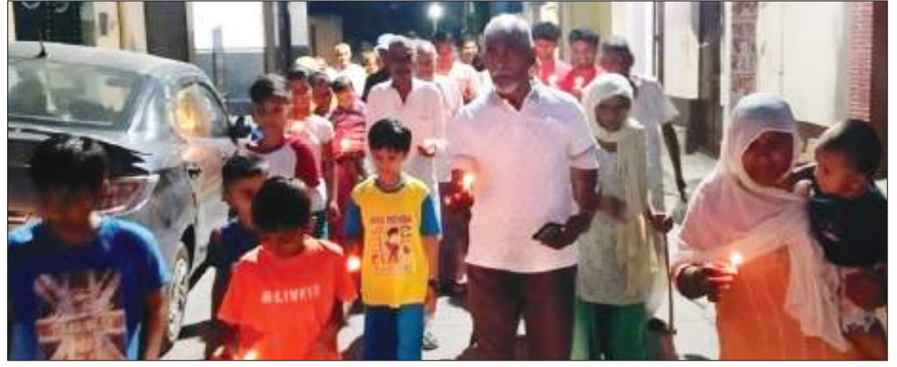
मृतकों के परिजनों के साथ देश का प्रत्येक नागरिक खड़ा है। वहीं इस रेल हादसे से सरकार को सीख

मानवीय भूल के कारण हुआ, जिसके कारण पूरे देश में शोक की लहर है। इस दुख की घड़ी में