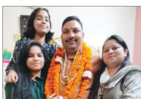
से मनाया गया। सुबह से ही उनको बधाई देने वालों का तांता लगा रहा। इस मौके पर क्षेत्र के राजनीतिक लोगों के अलावा सामाजिक व